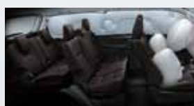
Airbags frontales (conductor y acompañante), de rodilla (conductor), laterales (x2) y de cortina (x2).