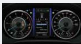
Tablero con display de información múltiple color de 4,2" (TFT).