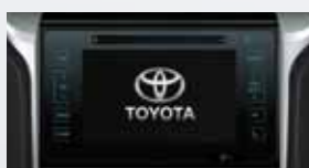
Audio con pantalla táctil de 7", GPS, TV digital, DVD, MP3 y Bluetooth®.