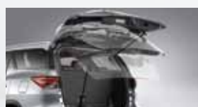
Portón trasero con sistema de apertura y cierre eléctrico.