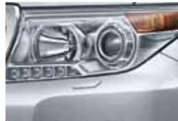
Gris Plata (1F7)