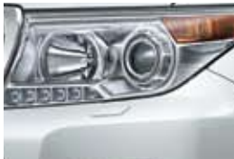
Blanco Perlado (070)