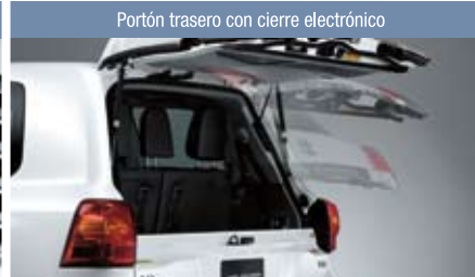
Portón trasero con cierre electrónico