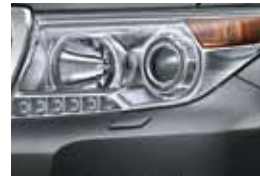
Gris Oscuro (1G3)