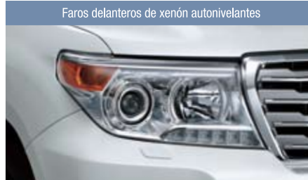
Faros delanteros de xenón autonivelantes